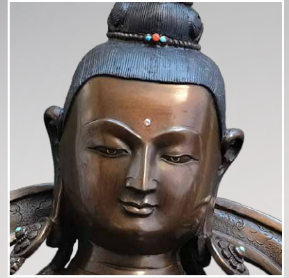
Kupfer-Statue Einfarbig oxidiert Höhe: 52 cm Breite: 39 cm Tiefe: 30 cm Gewicht: 12,5 kg

Vajrasattva (Dorje Sempa) gilt als Bodhisattva der Reinheit und wird in der Vajra-Familie verehrt. Er wird geschätzt, weil er Praktizierende dabei unterstützt, unheilbares Karma aufzulösen und innere Reinheit zu erlangen. Die Verbindung aus ethischer Lebensführung und Vajrasattva-Meditation ist darauf ausgerichtet, genau diese Reinigung und innere Klarheit zu ermöglichen.